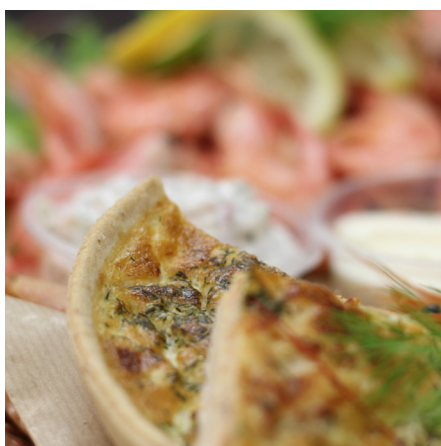
Laxfat lyx + paj, skagen, sallad, bröd