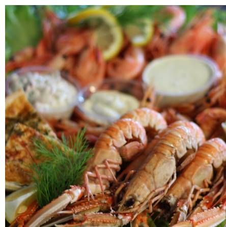
Räkfat, havskräftor, såser, hembakat bröd