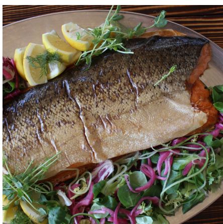
Laxfat Lax, romsås, potatis

Önskar du beställa färdiglagad mat till nyår? Då har vi lösningen här. Allt levereras kallt, och antingen ska det ätas som det är eller så får man en mycket enkel instruktion om hur man värmer upp maten. Såklart kan man också titta in vår butik och handla godsakerna och lägga upp det på favoritfatet. Vi har möjlighet att få hem de flesta skaldjur och fisksorter men behöver din beställning senast 28/12, men gärna före för större chans att du ska få tag i dina favoriter.